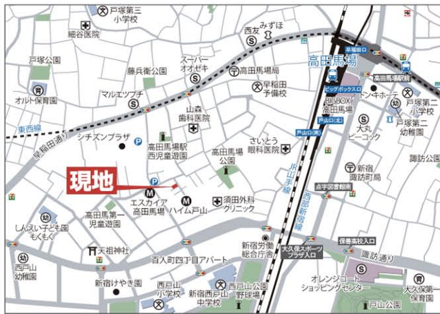
■Guide MAP 新宿区高田馬場4丁目22-25 とカーナビに入れて下さい。

山手線「高田馬場」駅まで徒歩6分で利用可能な好立地！ 高田馬場4丁目アドレス、高台の好立地に佇む都心型住宅