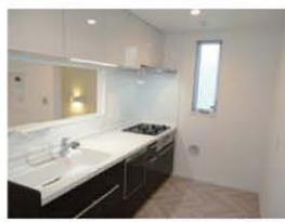
※現地写真(平成28年3月撮影)