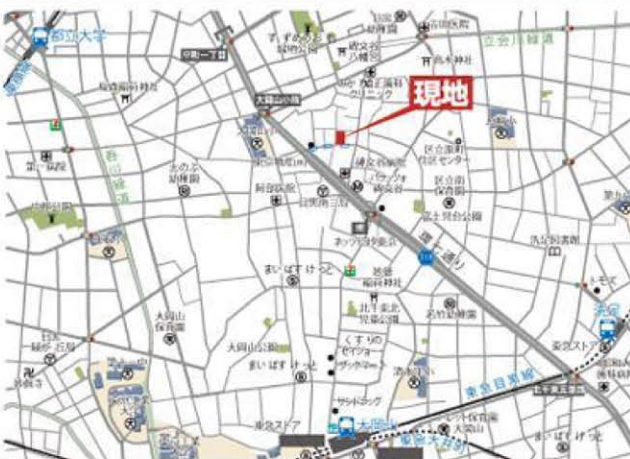
Guide MAP 目黒区南2丁目10-11 とカーナビに入れて下さい

最終1区画! 販売価格 A区画 6,150 万円 建物価格 2,230 万円 (税込) 土地建物総額 8,380 万円 (税込)