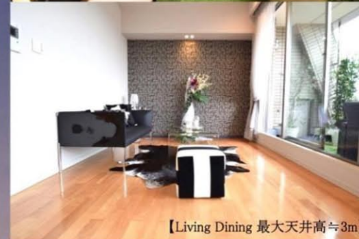
【Living Dining 最大天井高≒3m】